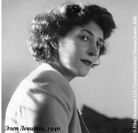
Элен Левитт, 1940

Время работы: понедельник – с 14 до 19, вторник – воскресенье – с 10 до 19, четверг – с 10 до 21 www.mumok.at