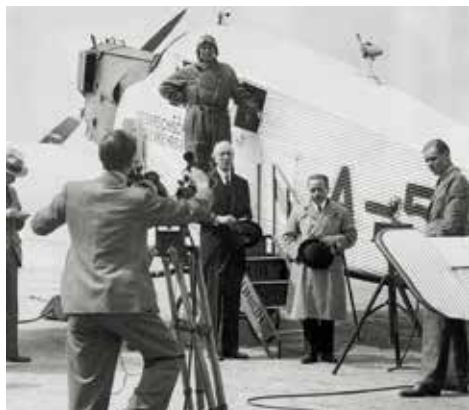
▲ Канцлер Энгельберт Дольфус в Лондоне, 1933

Время работы: ежедневно – с 10 до 18, понедельник – выходной день www.akademiegalerie.at