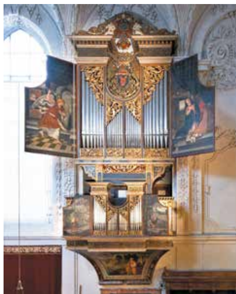
▼ Орган в Придворной церкви

Серебряная капелла, где навеки упокоилась душа Фердинанда II Габсбурга, отличается нереальной красотой и в то же время удивляет размерами. Занимая внушительную часть Придворной церкви, эта часовня была рассчитана на двоих, ибо только здесь эрцгерцог смог, наконец, воссоединиться с Филиппиной Велзер, которой этикет не позволял жить вместе с супругом. Свое нежное название капелла получила из-за убранства: статуя Девы Марии, алтарь и почти вся утварь здесь выполнены из серебра. На надгробии Фердинанд изображен по традиции коленапреклоненным, в полном вооружении. На счету покойного немного сражений, и почти все они запе-