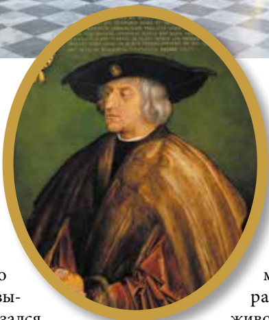
▲ Альбрехт Дюрер. Портрет Максимилиана I, 1519

Честолюбие владыки Священной Римской империи рождало блестящие проекты. Осуществлялись они крайне редко, чему всегда мешало одно заурядное обстоятельство: деньги, точнее, их отсут-