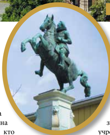
▲ Памятник Леопольду

С середины XVII века и до последних лет существования графства Тиролем управлял Леопольд Габсбург. По примеру предшественников он жил в Инсбруке, но, в отличие от них, уделял меньше времени войнам и гораздо больше интересовался искусством, литературой и науками. Во-