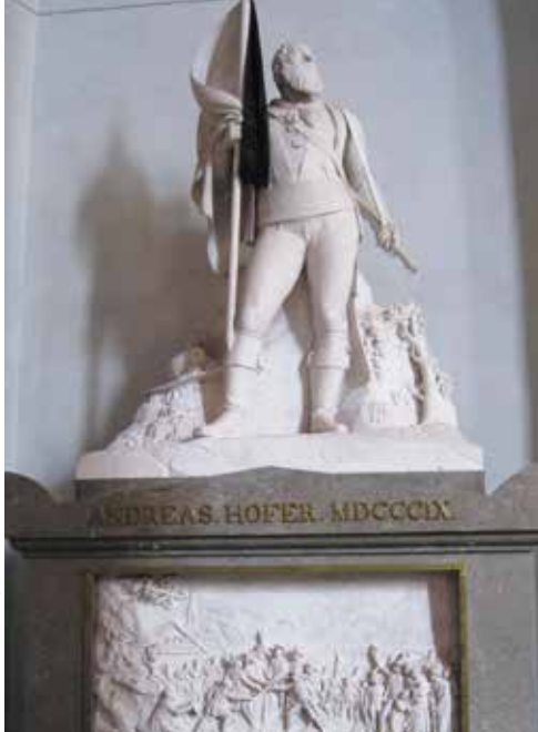
▲ Статуя Андреаса Хофера

1515), поражения венецианцев у Каллиано (1487), взятия крепости Аррас (1492), осады Куфштайна и обращения в бегство богемцев при Регенсбурге (1504), унижения герцога Гелдернского (1505), сдачи Падуи (1509), победной осады Турина (1513), удачной защиты Вероны (1516), осаждаемой все теми же венецианцами, с которыми Максимилиан воевал много и успешно.