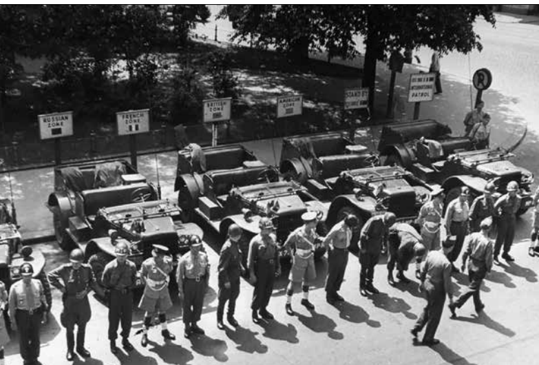
▲▼ Межсоюзные патрули в послевоенной Вене