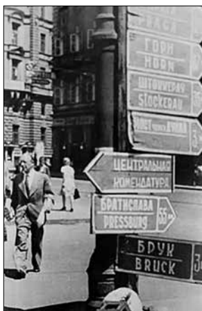
▼ Послевоенная Вена

▼ Представители союзного командования: маршал Конев, генерал Бетуар (Франция), генерал Кларк (США) и генерал Маккрири (Великобритания)