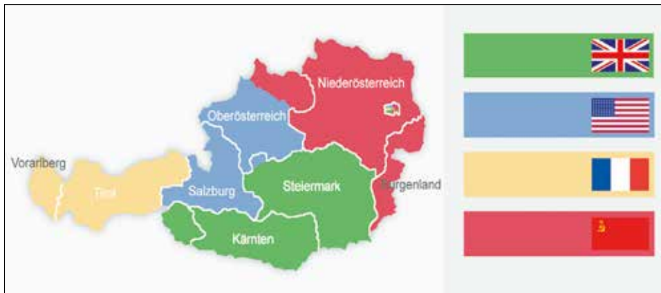
▼ Оккупационные зоны в Австрии

После окончания Второй мировой войны территория Австрии (в ее границах до аншлюса в 1938 году) была поделена между четырьмя державами-победительницами на оккупационные зоны. Отдельно разделена была также столица – город Вена.