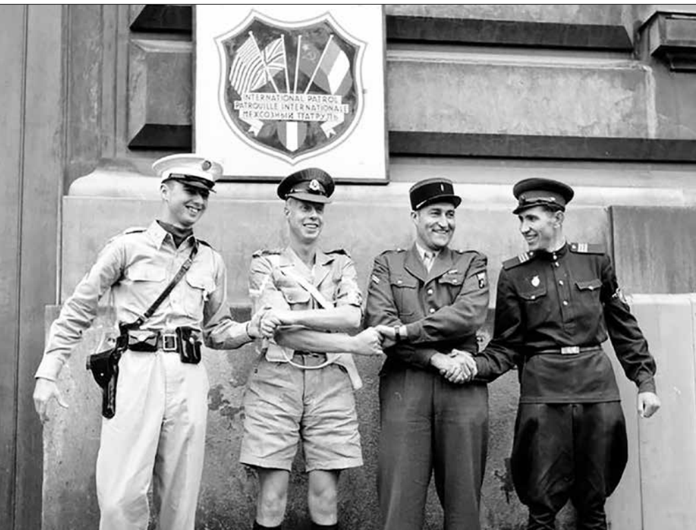
▲ Межсоюзный патруль в послевоенной Вене