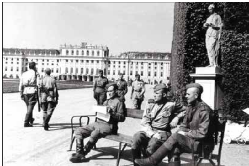
▲ Советские солдаты в парке дворца Шёнбрунн