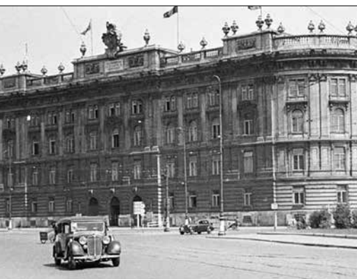
▼ Послевоенная Вена

На все принятые парламентом Австрии законы до их официального опубликования федеральное правительство страны должно было получать добро от Союзнической комиссии. В отсутствие разрешения этого органа австрийский закон не мог вступить в силу. В начале деятельности Союзнического совета каждая из оккупационных держав могла наложить вето на неудобный закон. Позднее было принято решение, что вето на закон налагается только всеми четырьмя сторонами совместно.