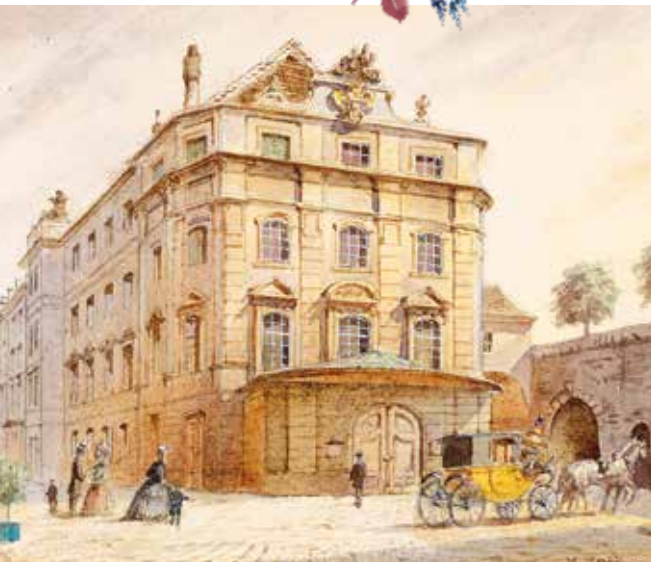
▲ Театр у Каринтийских ворот.