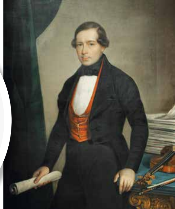
▲ Йозеф Ланнер.

Подолгу задерживаться на одном и том же месте было не в