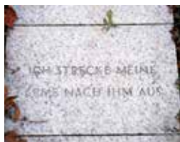
▼ Гранитные плиты с надписями