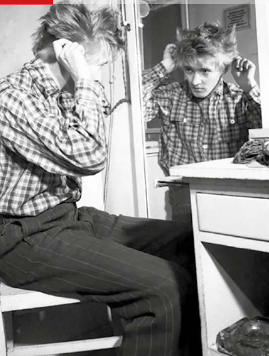
▲ Оскар Вернер на сцене театра, 1949 г.