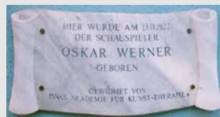
▲ Памятная табличка на доме в переулке MARCHETTIGASSE, где родился актер.

И звестный австрийский актер Оскар Вернер (имя при рождении – Оскар Йозеф Бшлиссмайер) появился на свет 13 ноября 1922 года в Вене. В детстве у него был очень красивый голос, и мальчик зарабатывал пением в хойригерах. Когда Вернеру исполнилось шесть лет, родители развелись, а восьмилетним он обнаружил мать на чердаке при попытке суицида . У будущего актера была сестра, но она рано умерла от лейкемии.