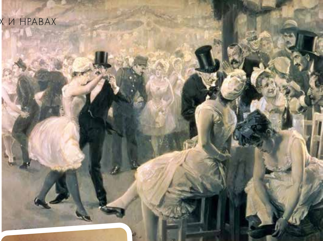
▲ Бал прачек в Вене (конец XIX-го века), В. Гаузе

«Прачки были одним из распространенных венских типов»