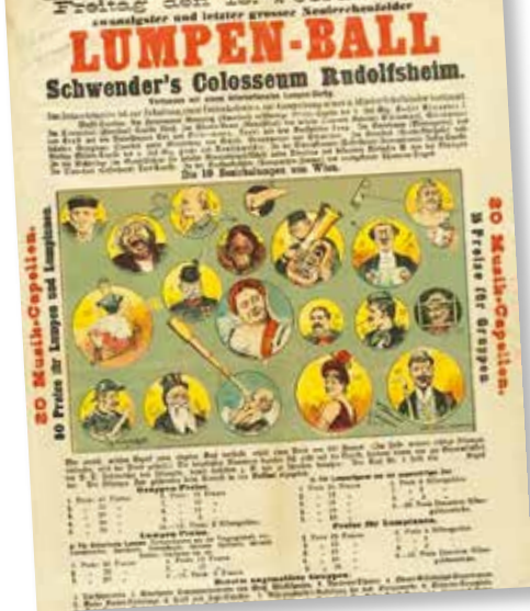
▲ Плакат о проведении бала нищих