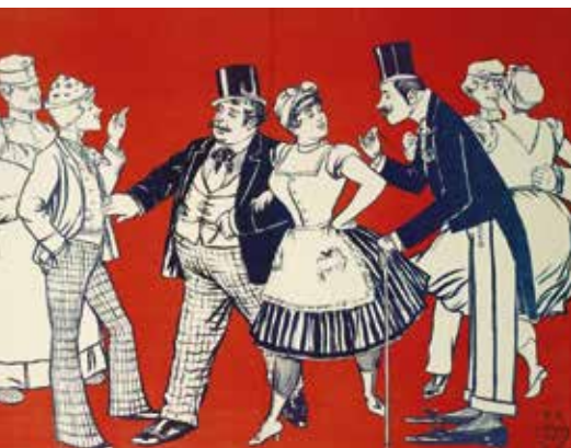
▼ Плакат для бала прачек

ДЛЯ АРИСТОКРАТОВ УСТРАИВАЛИ РОСКОШНЫЕ БАЛЫ, НО И ОСТАЛЬНЫЕ СЛОИ НАСЕЛЕНИЯ ТОЖЕ НЕ СКУЧАЛИ. ДЛЯ КАЖДОГО НАХОДИЛСЯ КАКОЙ-ТО БАЛ, ГДЕ ОН МОГ ПРЕДАТЬСЯ ТАНЦАМ И ВЕСЕЛЬЮ. УСТРАИВАЛИСЬ БАЛЫ ПРЕДПРИНИМАТЕЛЕЙ, АПТЕКАРЕЙ, ВРАЧЕЙ, ЮРИСТОВ, СТУДЕНТОВ, РЕСТОРАТОРОВ, ПАРИКМАХЕРОВ, КОНДИТЕРОВ, ПОЖАРНЫХ, ОХОТНИКОВ... А ТАКЖЕ БАЛЫ ПРАЧЕК, КУЧЕРОВ И ДАЖЕ ...БАЛЫ НИЩИХ.