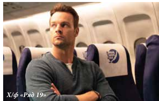
Х/ф «Ряд 19»