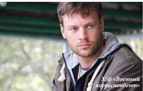
Х/ф «Военный корреспондент»