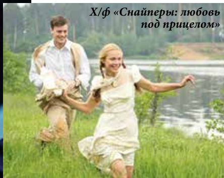
Х/ф «Снайперы: любовь под прицелом»