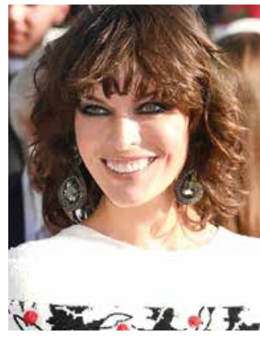
▲ Милла Йовович на Каннском фестивале.

В 2005 году актриса прибыла на свою историческую родину. В столице Украины Милла посетила Владимирский собор, музей Михаила Булгакова, прогулялась по Андреевскому спуску. Йовович купила на память несколько украинских «вышиванок», украшений из бисера, жилетки и буденовку. Милла