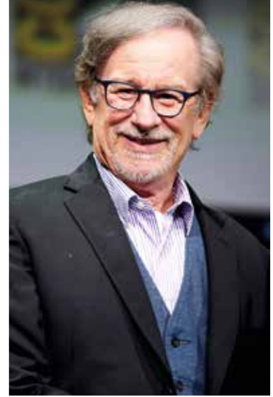
▲ Стивен Спилберг.

Режиссер эротической мелодрамы «Сафо» Роберт Кромби изначально решил, что американцев в картине будут играть американские актеры, греков – греческие, а русских – русские и украинские. Когда их отобрали, оказалось, что исполнительница главной роли Сафо – Авалон Барри – американка с украинскими корнями. Ее бабушка и дедушка – наши соотечественники. Девушка планирует в будущем и дальше сниматься на Украине.