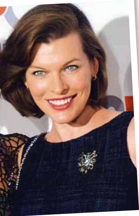
▲ Милла Йовович.