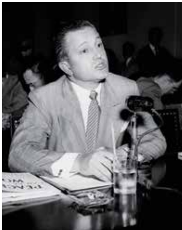
▲ Эдвард Дмитрик.

чатлениям он прибавил не менее суровый эмигрантский опыт в Соединенных Штатах, где начинал свою «карьеру» с мытья туалетов и доставки цветов на похороны. В один прекрасный день (это было в 1996 году) он махнул в Нью-Йорк, где наконец смог всерьез задуматься о создании ансамбля, который потом прогремел на весь мир.