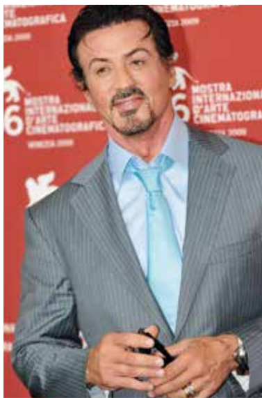
▲ Сильвестр Сталлоне.