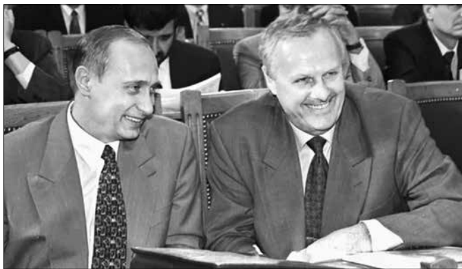
▲ Владимир Путин и Анатолий Собчак

Вот почему я люблю Вену. Только никак не удастся побыть здесь всласть, хотя бы дня три-четыре (я уж не говорю – неделю),