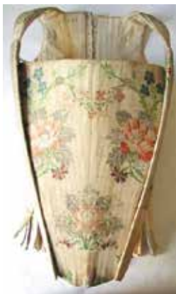
▲ Цветной корсет XVIII-го века