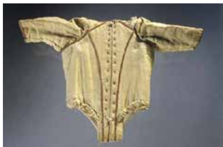
◀ Так выглядел детский корсет