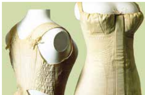
◀ Корсет с задней шнуровкой