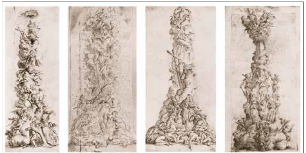
▼ Эскизы новой колонны, предложенные театральным художником Людовико Оттавио Бурначини / Österr. Nationalbibliothek

Новую концепцию колонны предложил театральный художник Людовико Оттавио Бурначини. Он был родом из Северной Италии, из Мантуи, и служил у Леополь-