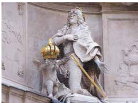
▲ Император Леопольд I в алонжевом парике

При рассматривании колонны возникает еще одна аллюзия. Колонна напоминает парик. В XVII веке накладные волосы, нашитые на матерчатую основу, выступали как часть декора и символизировали собой эпоху. Моду на парики ввел «король-солнце» Людовик XIV (1638–1715). Вначале этот аксессуар походил на «большое облако» из локонов, обрамлявших лицо. Парик стал статусным головным убором для высшего общества, появляться без него было неприличным. Более всего ценились белокурые парики. Поскольку светлые волосы встречались сравнительно редко, многие осыпали темные парики рисовой пудрой. В 1670-х годах локоны стали укладывать в строгом порядке. К 1690-м годам в моду вошел аллонж – парик с длинными волнистыми локонами.