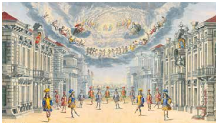
▲ Гравюра работы театрального художника Людовико Оттавио Бурначини