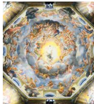
▲ Корреджо. Вознесение Девы Марии. Пармский собор.

да I в качестве сценографа и театрального машиниста для придворных развлечений. Его работы сохранились на многочисленных гравюрах. На многих из них повторяется один и тот же прием: при помощи театральной машины на сцену выпускались облака, которые возносили Святую Троицу на небо. Эффект был ошеломительным.