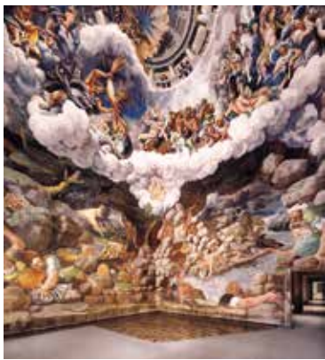
▲ Джулио Романо. Мантуя. Палаццо дель Те. Зал Гигантов.