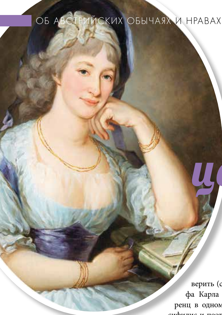
▲ Мария Эрнестина Штаремберг (1754–1813) – виновница громкого скандала