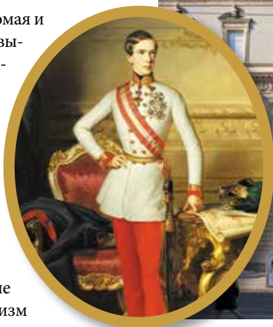
▲ Император Франц Иосиф I

Увлечшись барокко, австрийцы так и не сумели оценить по достоинству другие архитектурные стили. Ни в столице, ни в провинциальных городах не приветствовался классицизм, но в Инсбруке неоантичные соору-