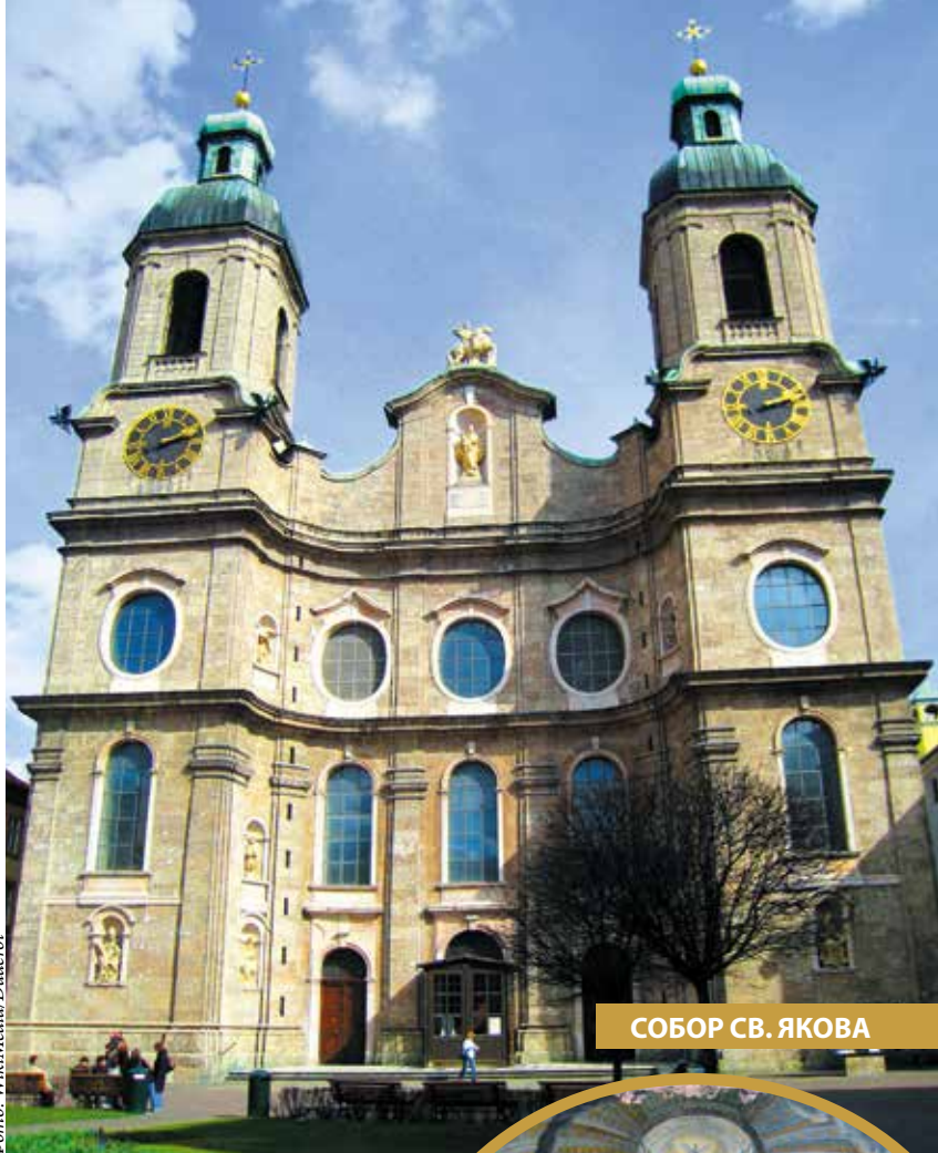
СОБОР СВ. ЯКОВА

Не испытав особых потрясений, собор Святого Якова уже более 300 лет действует в качестве приходской церкви. Его двери распахнуты и для верующих, и для праздной публики, которой, с учетом небольшого населения Инсбрука, собирается больше, чем прихожан. Многие заходят сюда не столько ради осмотра гробницы и странного творения Кранаха, сколько для того, чтобы насладиться чистым звуком колокола, не так давно помещенного на Северной башне. Говорят, что мелодия перезвона призывает к миру.