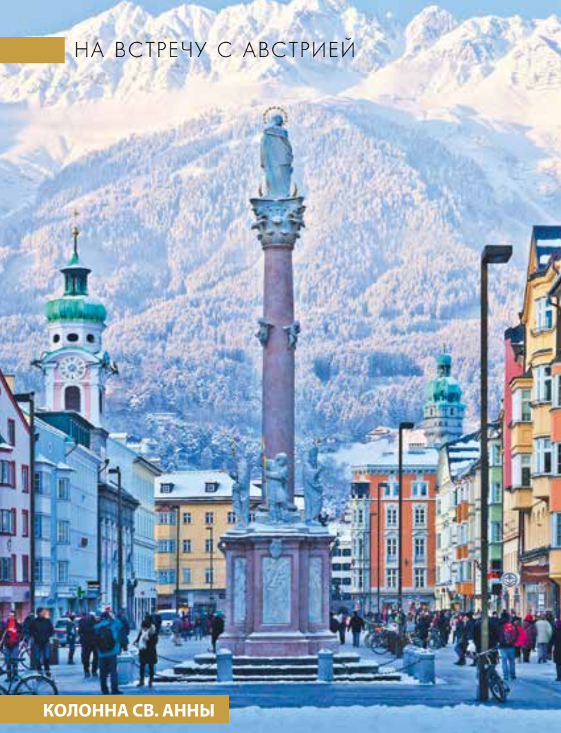
КОЛОННА СВ. АННЫ