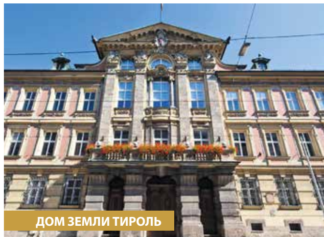
ДОМ ЗЕМЛИ ТИРОЛЬ