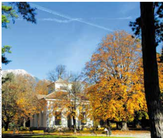
▲ Музыкальный павильон в Придворном парке