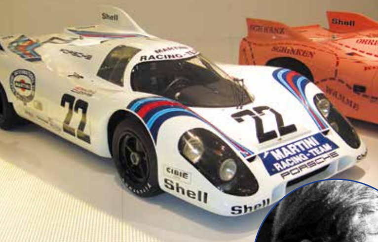
▲ Гоночный автомобиль PORSCHE 917K, на котором Марко победил в 24-часовой гонке в Ле-Мане.